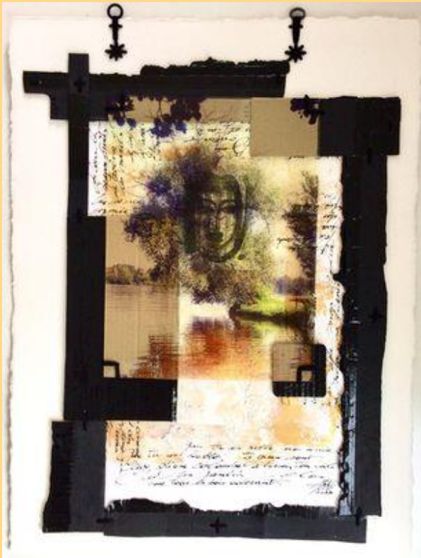
Absinthe et herbes folles