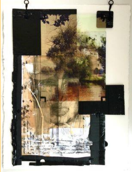
Soudain la brise