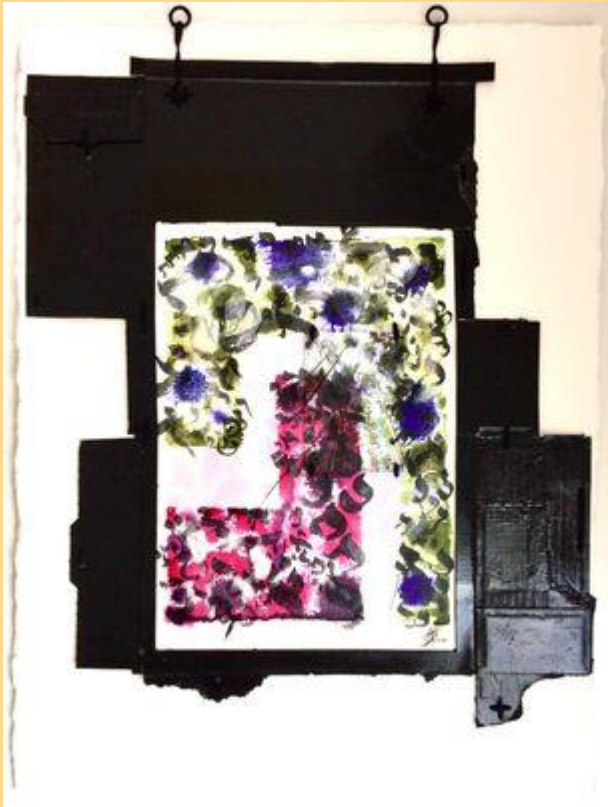
Cœur de ciel pur