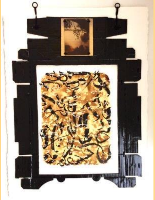
Sous le figuier