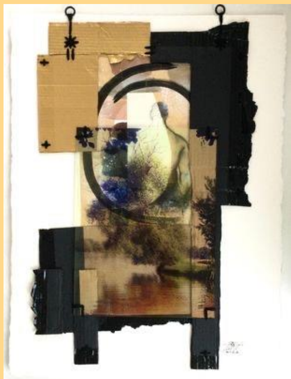
Caresse de vison