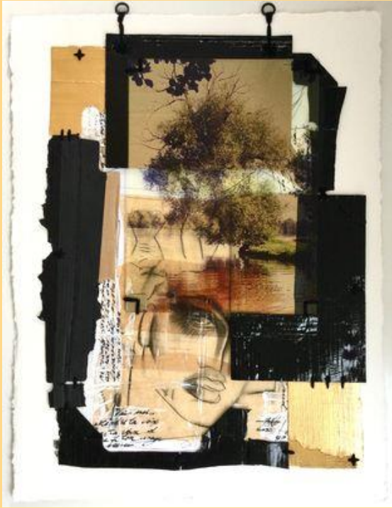
Paresse de l'éventail