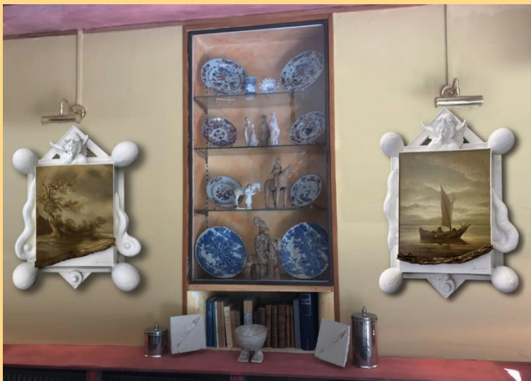
Titre : Fenêtre sur l'intemporel Dimension : 50X80 cm Valeur : 3500 euros chacun, diptyque 6000 euros