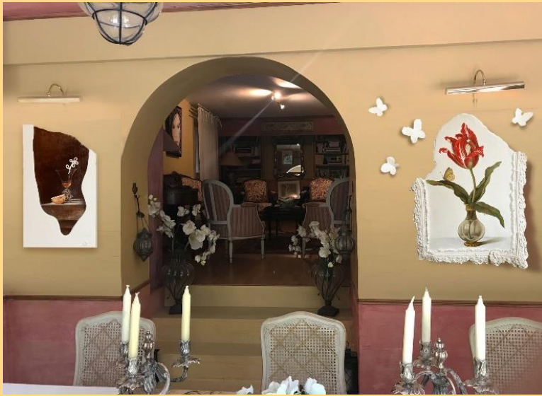
Titre : Echo du passé et du présent, Transition Dimension : 50X87, 67X87 cm Valeur : 3000 euros chacun