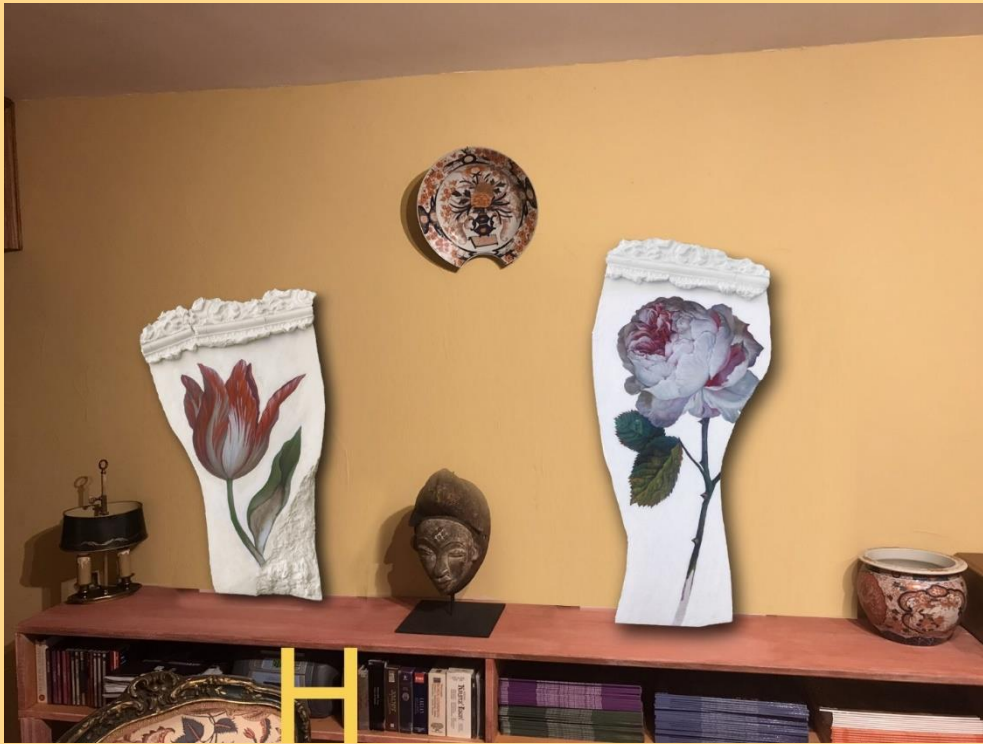
Titre : Instant suspendu Tulipe et Rose Dimension : 33X56, 31X66 cm Valeur : 2000 euros chacun