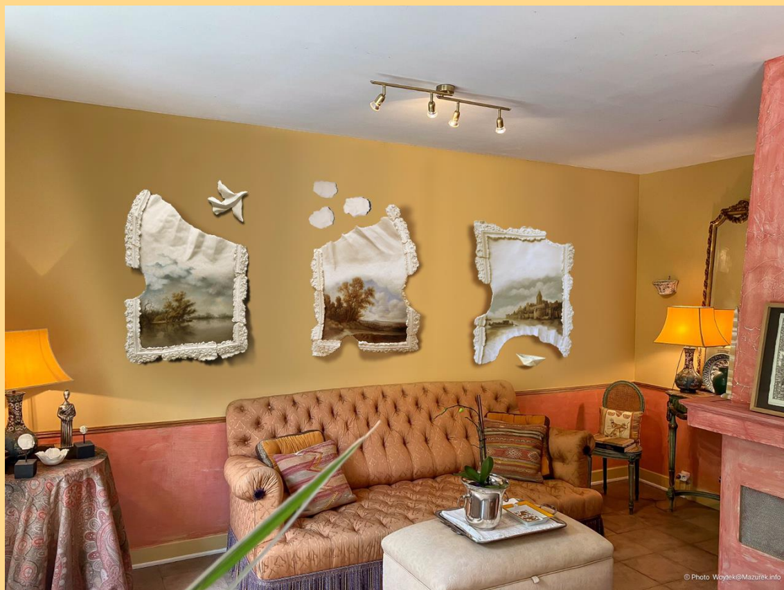
Titre : Paysage avec oiseau, avec nuage, avec bateau Dimensions : 72X93, 73X92, 72X88 Valeur : chacun 4000 euros, Triptyque : 11 000 euros