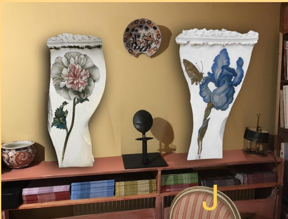
Titre : Instant suspendu, Pivoine et Iris Dimension : 29X66, 42X64 cm Valeur : 2000 euros chacun