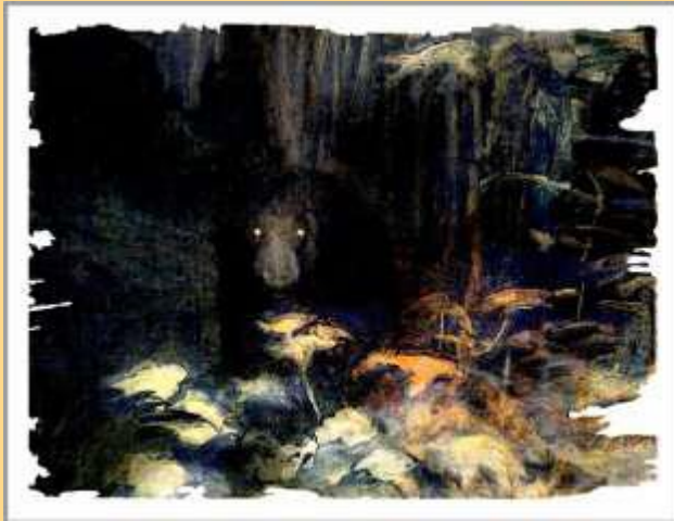
A Secret Life of Animals #4 Tirage sur papier Hahnemühle Edition limitée 390€