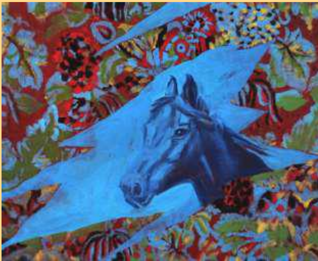
Forti e Gentili – le cheval bleu 2023 Huile sur toile 3200€