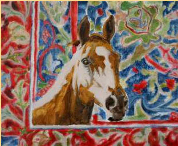
Forti e Gentili – le cheval blanc 2023 Huile sur toile 2400€