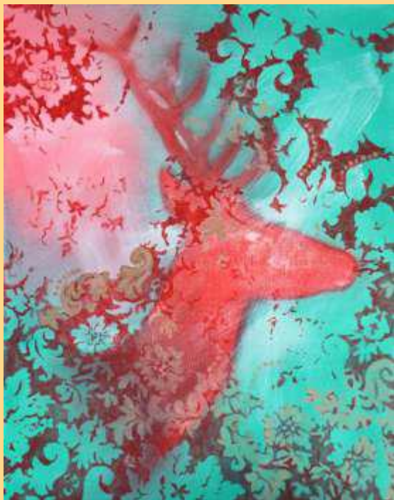
Forti e Gentile – Cerf rose et vert 2022