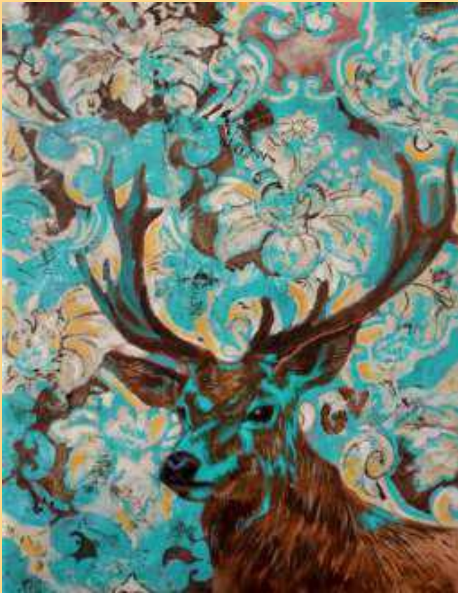
Forti e Gentili – le cerf vert 2023 Huile sur toile 3200€