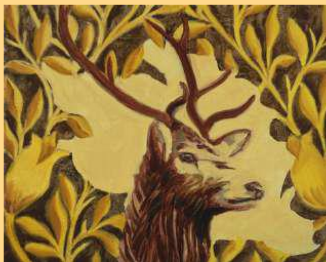
Forti e Gentili – le cerf jaune 2023 Huile sur toile 2400€