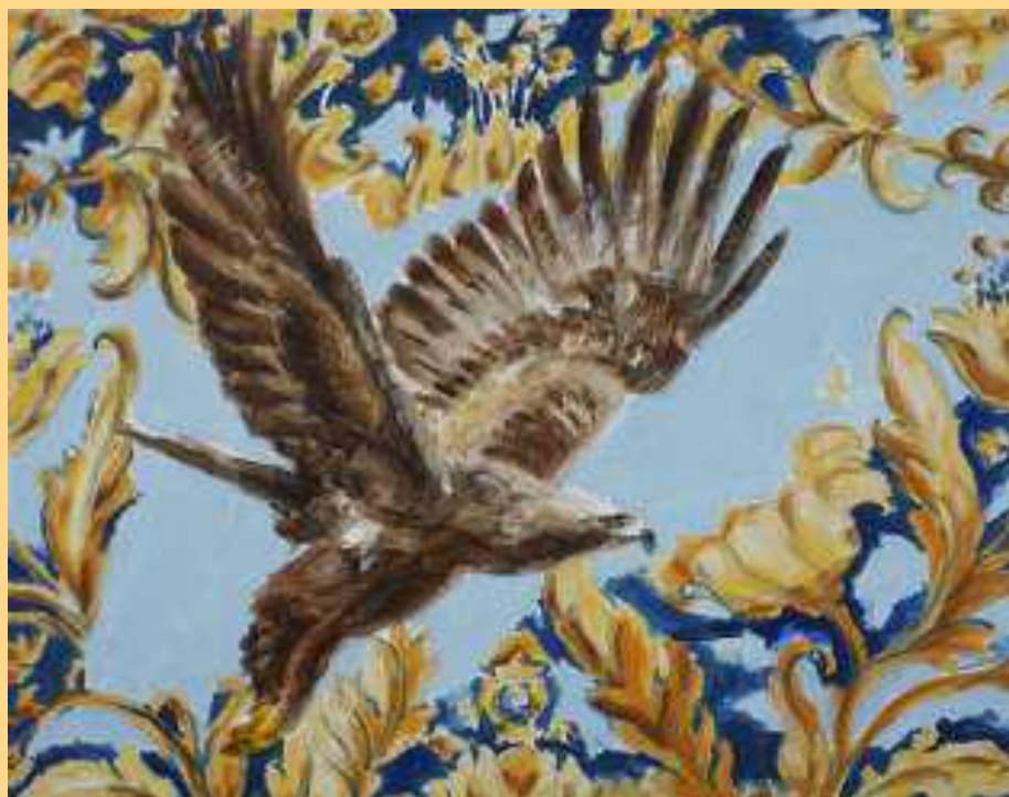
Forti e Gentili – l'aigle 2023 Huile sur toile 2400€