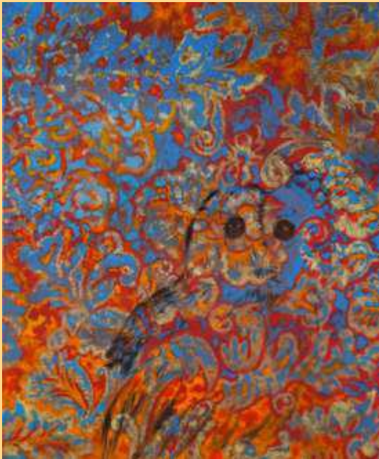
Forti e Gentili – Le hibou 2023 Huile sur toile 3200€