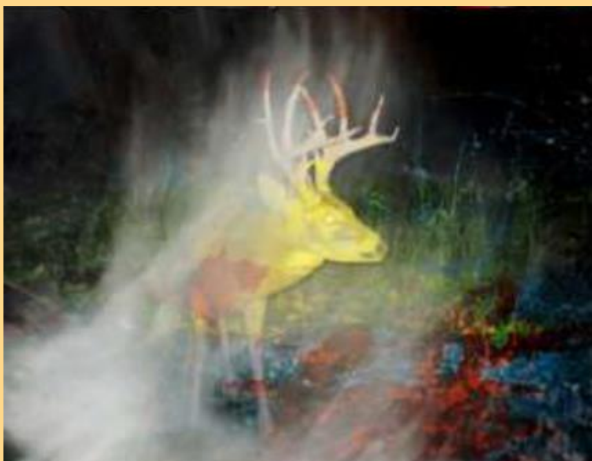
A Secret Life of Animals #23 Tirage sur papier Hahnemühle Edition limitée 390€