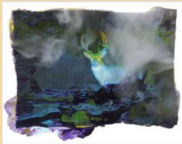
A Secret Life of Animals #45 Tirage sur papier Hahnemühle Edition limitée 390€