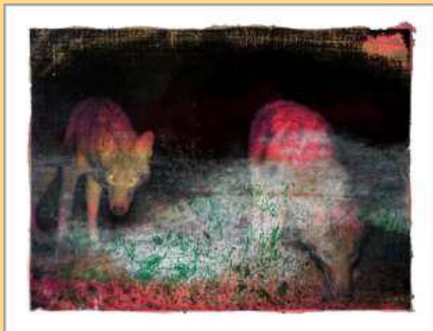
A Secret Life of Animals #8 Tirage sur papier Hahnemühle Edition limitée 390€