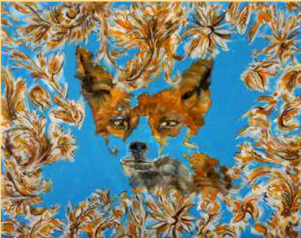
Forti e Gentili – le renard 2023 Huile sur toile 2400€