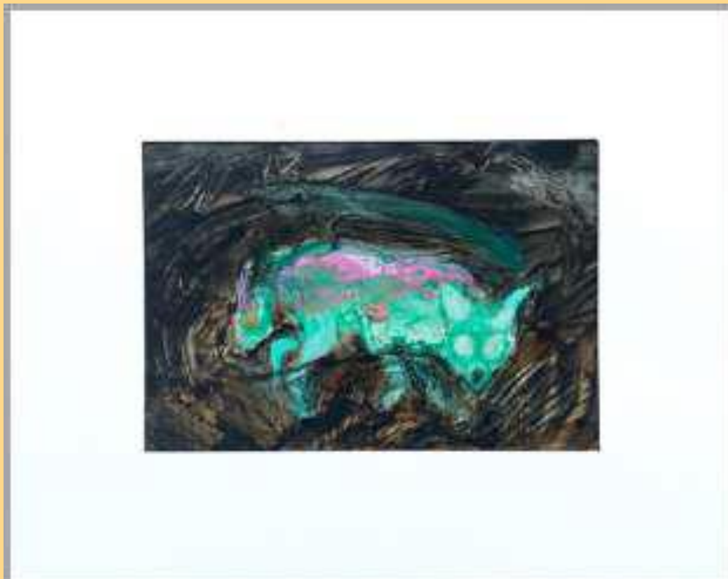
Renard vert 2018 Huile sur calque 650€

2 huiles sur calque encadrées 25 x 31 cm