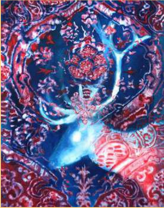
Cerf bleu sombre 2022 Huile sur toile 4800€