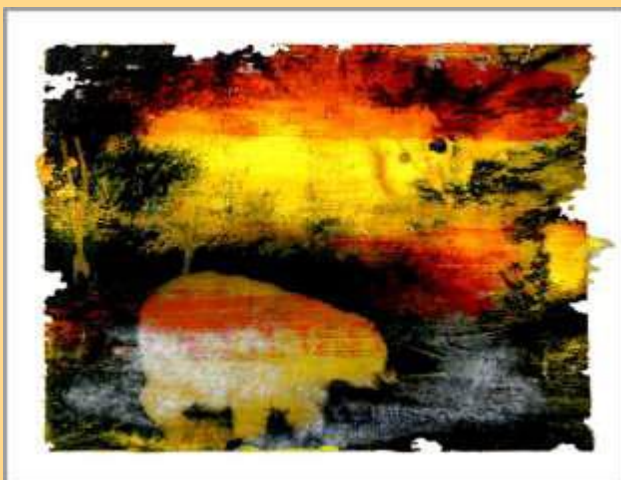
A Secret Life of Animals #3 Tirage sur papier Hahnemühle Edition limitée 390€