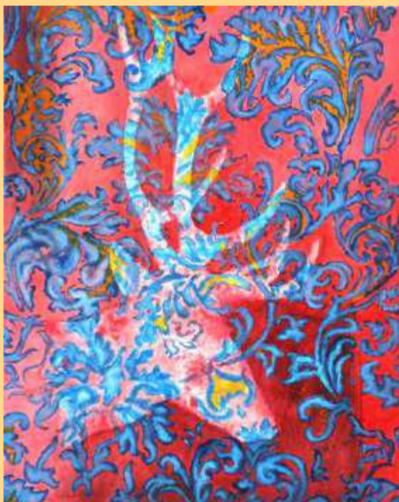
Cerf rose dans un palace italien 2023