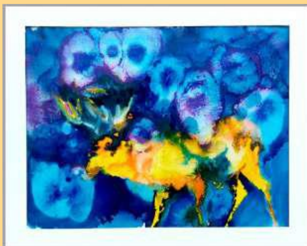
Cerf jaune 2018 Huile sur calque 650€